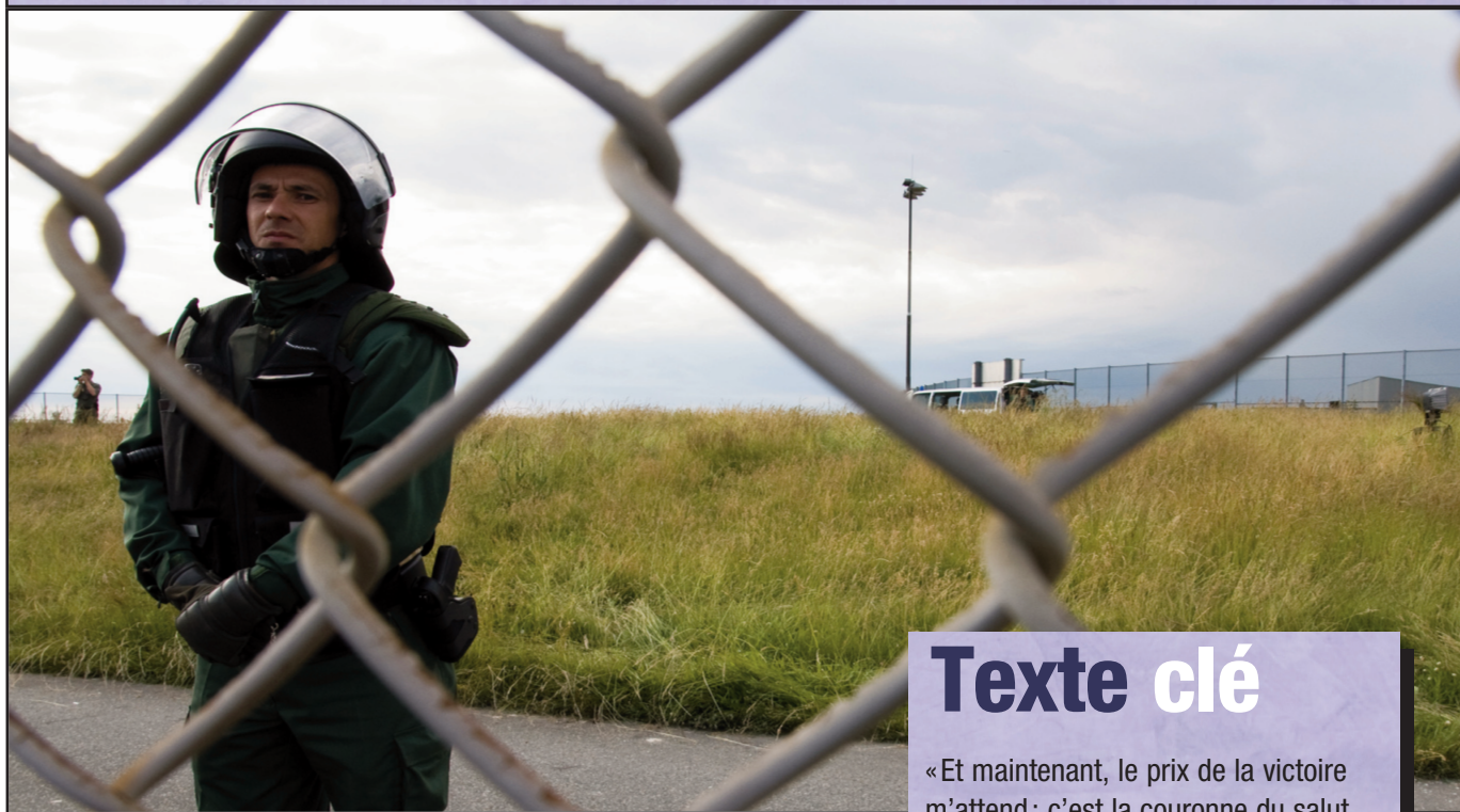
Urbanart Cove eu